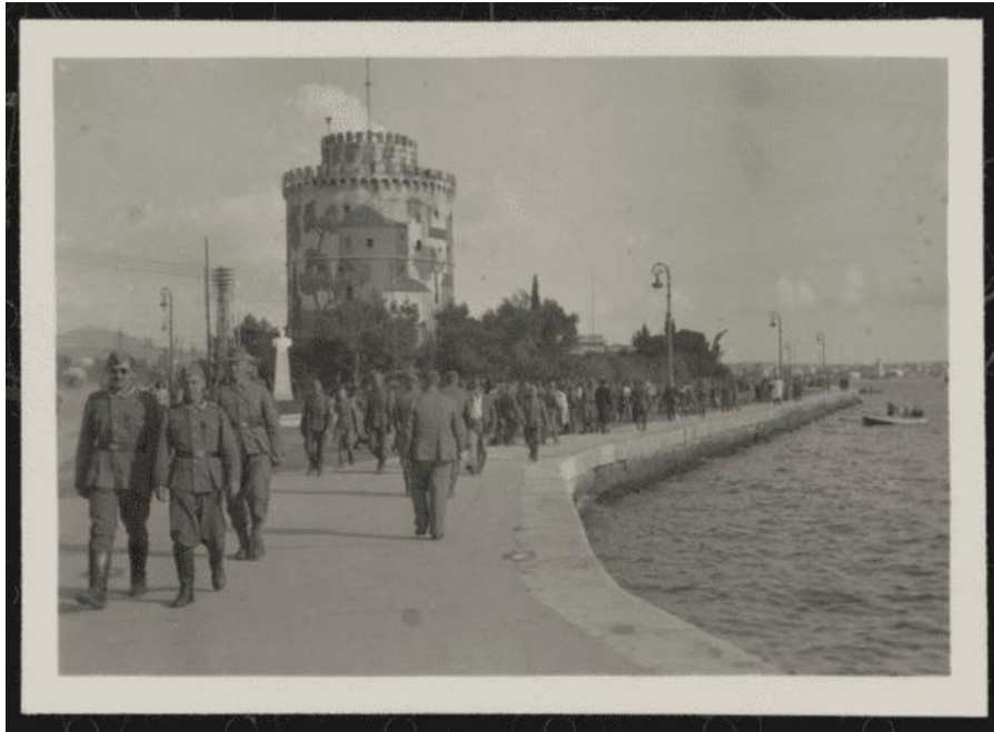
Άποψη της παραλίας Θεσσαλονίκης - Набережная города Салоники

Немецкие оккупационные силы составляли 100 000-120 000 человек, а итальянские - 140 000 человек. Болгарских солдат было около 40 000.