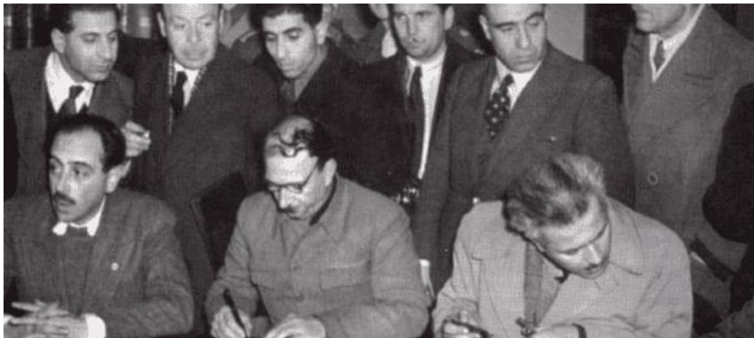
Υπογραφή Συμφωνίας Βάρκιζας , 12 Φεβρουαρίου 1945 – Подписание Соглашения в городе Варкиза, прекращение огня, разоружение отрядов ЭЛАС, 12 февраля 1945г.