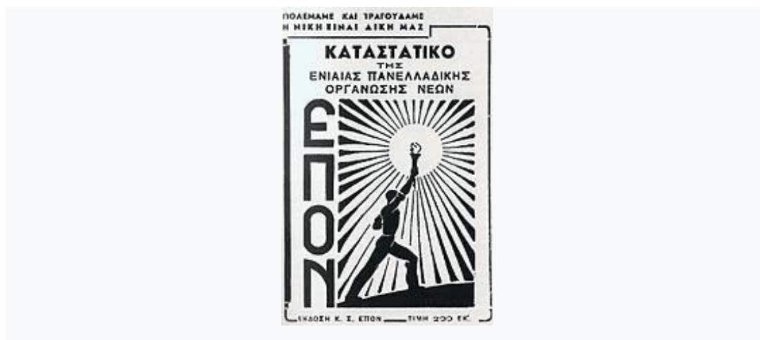
Φυλλάδιο με το καταστατικό της ΕΠΟΝ, 1943 / Брошюрка с Уставом ЭΠΟΝ.