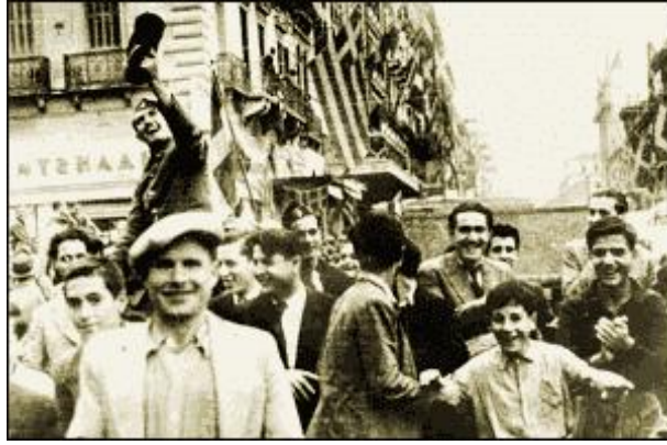
Από τους μεγάλους πανηγυρισμούς της Αθήνας, για τις νίκες του ελληνικού στρατού εις βάρος των Ιταλών εισβολέων – Большой праздник в Афинах. Люди отмечают победы греческой армии над итальянскими войсками

Греко-итальянская война длится 216 дней – с 28 октября 1940 г. по 31 мая 1941 г. Первые 160 дней отмечены победами греческой армии над итальянскими войсками. Затем 5 апреля 1941 г. в войну вступает Германия, и в течение 25 дней греческие войска при поддержке ограниченного контингента английских войск оказывают героическое сопротивление превосходящим силам итало-германских агрессоров. К 30 апреля 1941 г. сопротивление было сломлено на большей части территории Греции, за исключением Крита, который еще 31 день остается последним оплотом сопротивления на греческой территории.