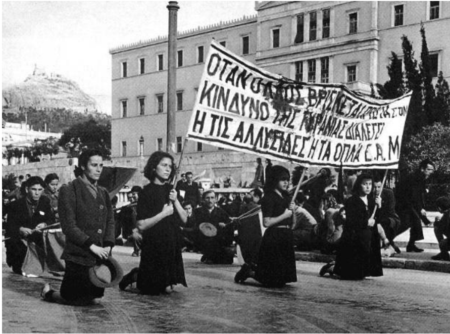
Κοгда народ находится под угрозой тирании, он выберет или свои цепи или оружие — ЭАМ. — Демонстрация в Афинах, перед зданием Парламента, декабрь 1944г.