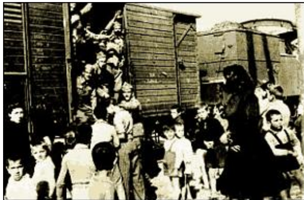
Η αναχώρηση για το μέτωπο – Отправление на фронт

Греческий народ смело и мужественно воспринимает сообщения о начале военных действий. Ни капли страха, ни капли волнения. Утром 28 октября 1940 г. народ выходит на улицы, сообщения о войне придают силы греческой нации, делают ее еще решительнее и сплоченнее.