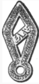
Διακριτικό του ΕΛΑΣ / Эмблема ЭЛАС

22 мая 1942г. партизанский отряд вступает в село Домница греческого округа Эвритании и объявляет крестьянам о начале вооруженной борьбы против завоевателей. Национально-освободительный эпос сопротивления начался.