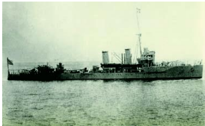
контрминоносец «Элли» - Το καταδρομικό "Έλλη"

28 октября 1940 г. Италия предъявляет греческому правительству ультиматум, в котором требует свободного передвижения по территории Греции итальянско-фашистских войск. Это приводит к патриотическому подъему в Греции: нация сплачивается в своей решимости дать отпор итальянскому фашизму. В этих условиях греческий премьер-министр, диктатор Иоаннис Μεταξас, несмотря на личную симпатию к режиму Муссолини, вынужден отвергнуть итальянский ультиматум, тем самым выразив желание нации.