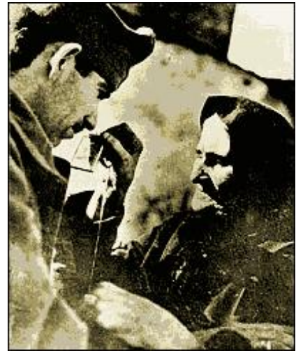
Το φυλαχτό της μάνας - Талисман на удачу от матери

Είναι αξιοθαύμαστος ο τρόπος, με τον οποίο σύσσωμος ο ελληνικός λαός αντιδρά στην είδηση του πολέμου που ξεχύνεται στους δρόμους το πρωί της 28 ης Οκτωβρίου. Δεν διακρίνεται ούτε φόβος ούτε απόγνωση στα πρόσωπα του κόσμου, μονάχα αποφασιστικότητα και θάρρος.